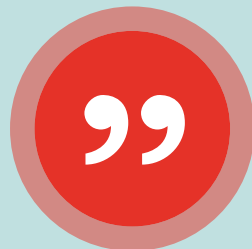
Fredrik, SPP Fonder